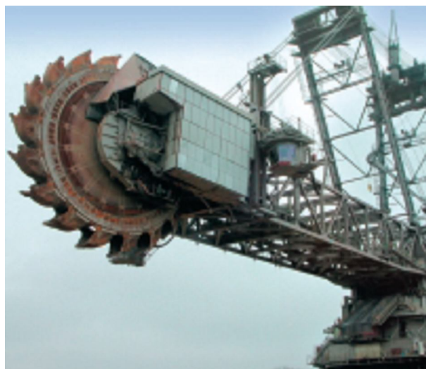
Industrijski telefon montiran u teškoj industriji