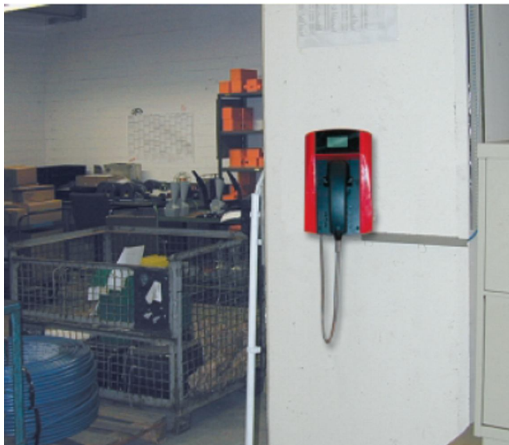
Industrijski telefon montiran u teškoj industriji